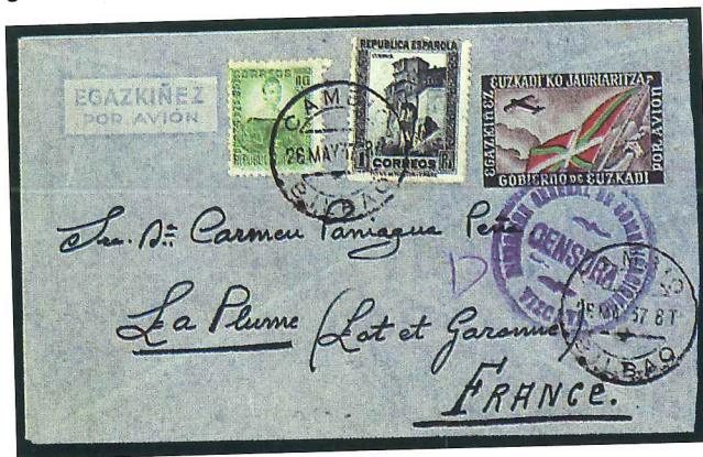
Aerograma del gobierno de Euzkadi de 1937, circulado a Francia. Es un ejemplar muy raro, que cuenta con una marca de censura de Bilbao.

Otro tema interesante es el de los territorios ocupados por diferentes administraciones postales, que dejaron allí sus oficinas, improntas, líneas y tarifas en diferentes lenguas. Tal es el caso de Palestina, que en diferentes épocas tuvo administraciones de correos turcas, austríacas, francesas, italianas e inglesas. Las colecciones también se pueden circunscribir a espacios geográficos más cercanos, coleccionando elementos y soportes pertenecientes al propio país, región, provincia..., e incluso —en las grandes ciudades— al propio distrito.