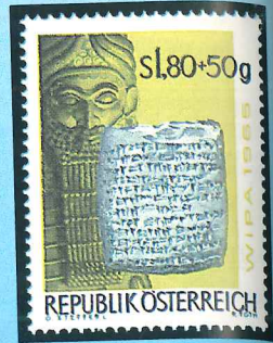
Dos de los sellos austriacos dedicados a la historia del correo, emitidos para la Exposición de Viena de 1965.

Con el desarrollo de la cultura egipcia, la escritura y los escribas, hacia el año 4700 a.C., famosos jeroglíficos nos muestran el funcionamiento de los denominados «correos del faraón a pie», que dieron paso hacia el año 1600 a.C. al correo a caballo. Los persas utilizaron cadenas de hombres a pie o a caballo, que se pasaban verbalmente o por escrito los mensajes. Los persas también iniciaron otro sistema de transmisión de mensajes: las golondrinas mensajeras. Alejandro Magno fue el primero que concibió la organización de un servicio postal (del Indo al Eufrates), utilizando caballos, camellos, elefantes, carros y barcos. En la Roma de Octavio Augusto, en el siglo I a.C., las tablas enceradas y escritas eran portadas por los tabellarii del emperador, unos funcionarios públicos o particulares, estableciéndose oficinas y estaciones en todas las vías militares del imperio.